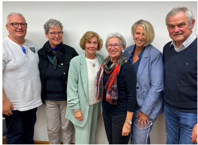
Das Team des Alzheimer Telefons – erste Anlaufstelle für vertrauliche Information, Beratung und Unterstützung rund um Demenz.

Im Mittelpunkt unserer Arbeit stehen Information, Beratung und Begegnung. Wir bieten ein niedrigschwelliges, kostenfreies Alzheimer-Telefon an, mit dem sich Betroffene, pflegende Angehörige und professionell Tätige vertraulich beraten lassen können. In Vortragsreihen, Gruppenabenden und der Schulungsreihe „Hilfe beim Helfen“ vermitteln wir praxisnahes Wissen rund um Demenz, Betreuung und Pflege. Besonders am Herzen liegen uns niedrigschwellige Teilhabeangebote, die Ressourcen stärken und Freude ermöglichen. Ein besonderes Anliegen ist uns der geschützte Raum für Austausch. Hier begegnen sich, Angehörige und Interessierte auf Augenhöhe. Oft entsteht aus dem gemeinsamen Gespräch das Gefühl: „Ich bin mit dieser Situation nicht allein“, und es werden ganz praktische Ideen ausgetauscht, wie sich der Alltag mit Demenz etwas leichter gestalten lässt. Neu entstanden ist eine Gruppe speziell für Partnerinnen und Partner von jüngeren Menschen (unter 70 Jahre) mit Demenz. Diese „jungen Angehörigen“ stehen häufig mitten im Berufsleben